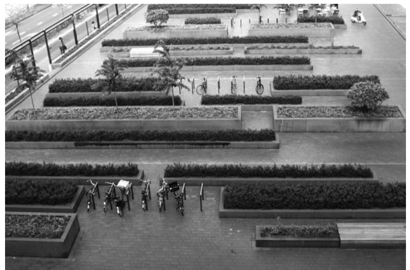
Jedną z prezentowanych na wystawie przestrzeni jest Mathildeplein w Eindhoven.

Mamy nadzieję, że wystawa „Gramy w zielone! Miejska Przestrzeń Publiczna” zachęci do dyskusji nad jakością przestrzeni w jakich mieszkamy, pracujemy, odpoczywamy. A okazją będzie zamkowa „domówka”.