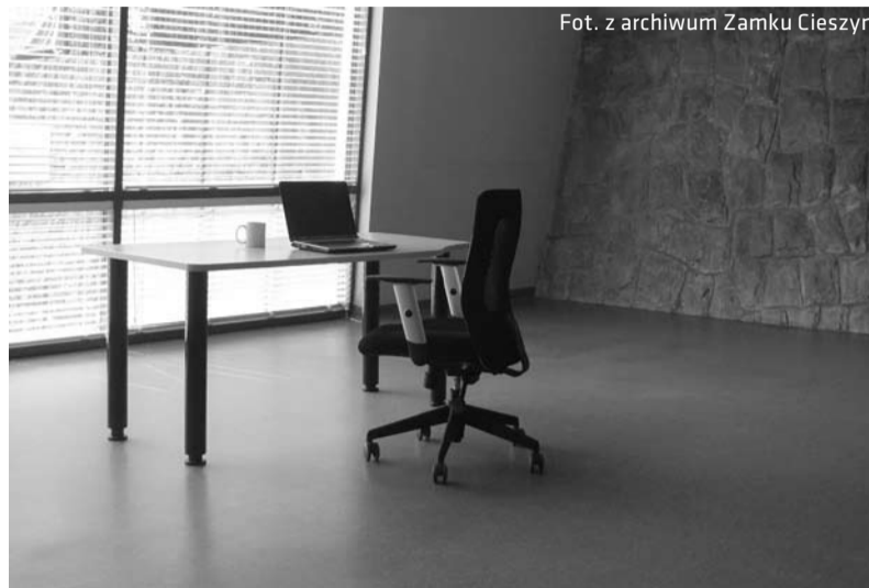
Powierzchnia biurowa w Zamku Cieszyn przeznaczona do wynajęcia

Informacje: kdorda@zamekcieszyn.pl lub 33 851 08 21 wew. 13.