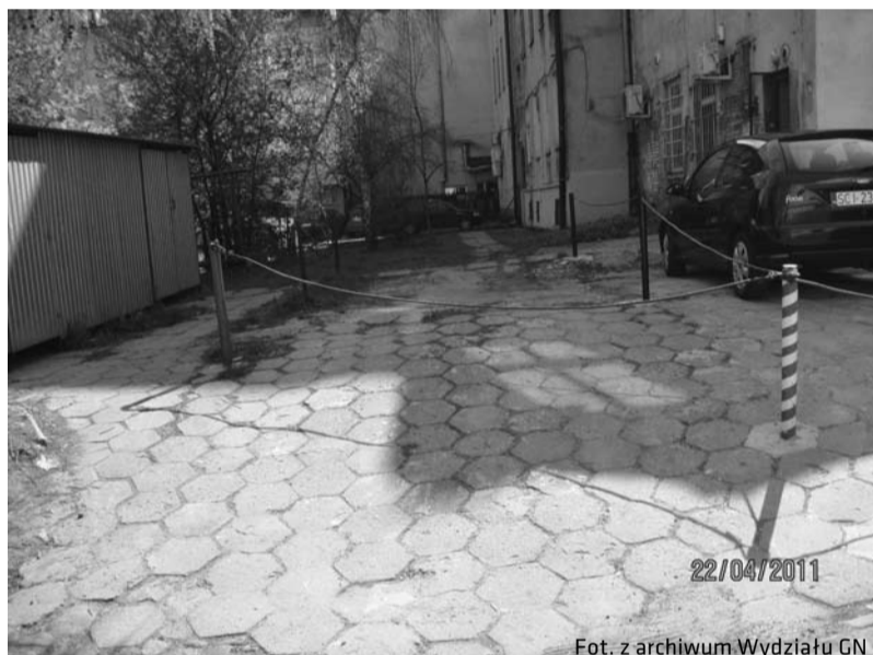
Miejsce parkingowe przeznaczone do dzierżawy przy ul. Kiedronia, stawka wyjściowa do przetargu 100 zł/miesiąc + VAT

Bliższych informacji w tej sprawie można zasięgnąć pod numerem telefonu 33 4794 230 lub 33 4794 278.