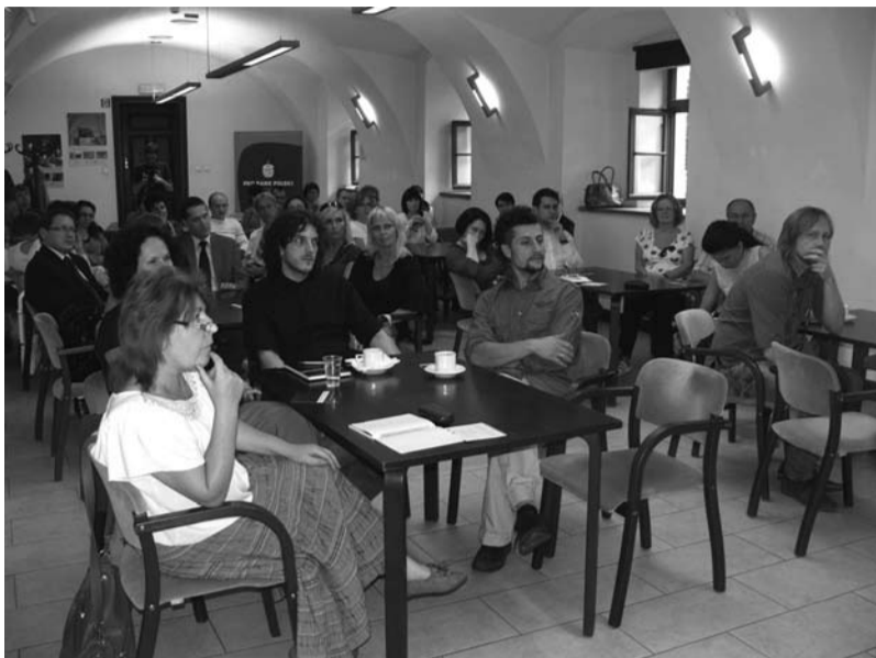
Uczestnicy spotkania szukali odpowiedzi na pytanie gdzie leży granica między wywieraniem wpływu na innych a manipulacją