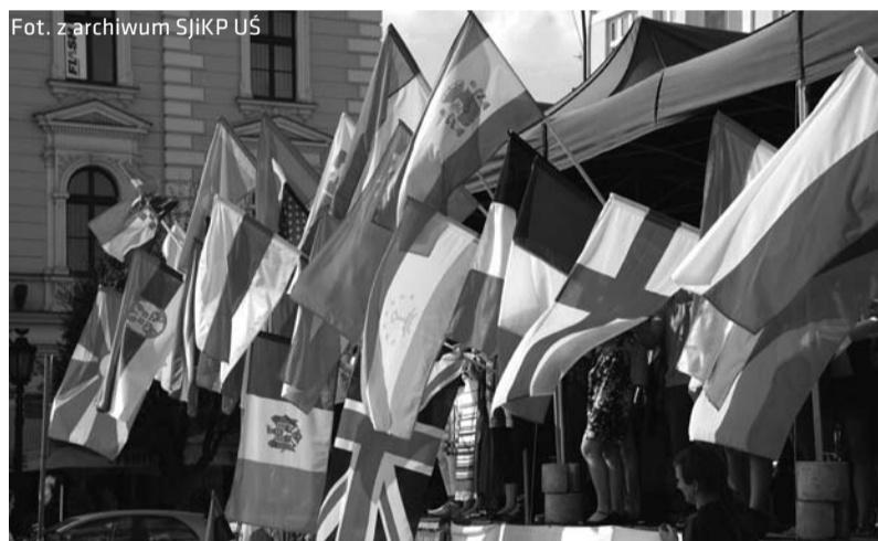
Na Wieczór Narodów na cieszyńskim Rynku studenci zapraszają 15 sierpnia ok. g. 15.00