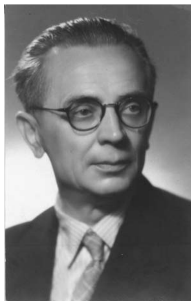
Gustaw Morcinek