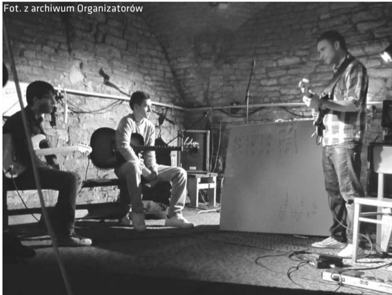
Warsztaty grania na gitarze