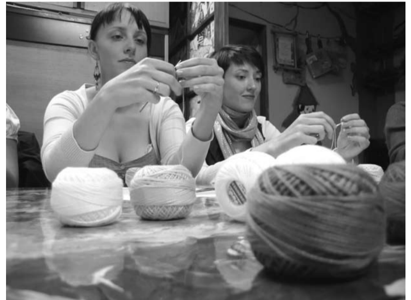
Na festiwalowych zajęciach będzie można stworzyć ręcznie wiele ciekawych przedmiotów