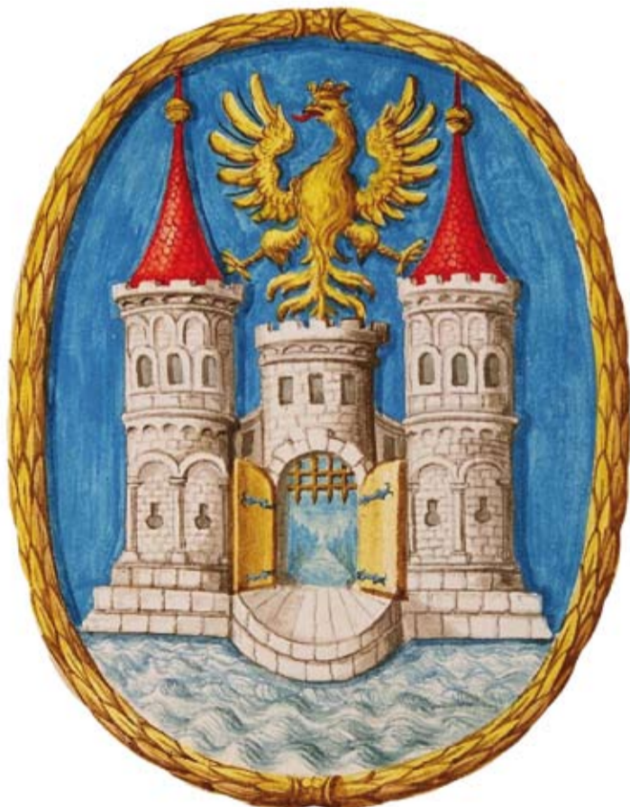
Herb Cieszyna w manuskrypcie Scuta nobilium Ducatus Teschinensis z pierwszej połowy XIX wieku

Pełny tekst wraz z przypisami znajduje się w I tomie „Dziejów Cieszyna od pradziejów do czasów współczesnych” pod. red. I. Panica.