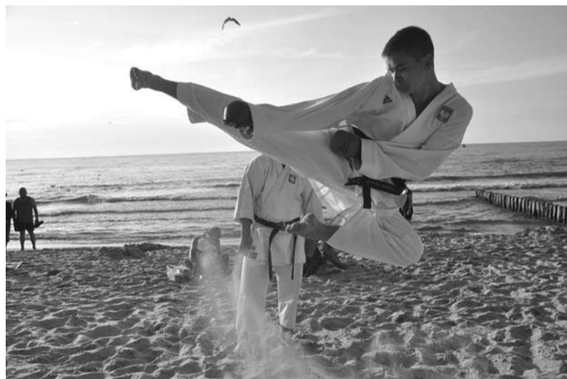
Trening na plaży