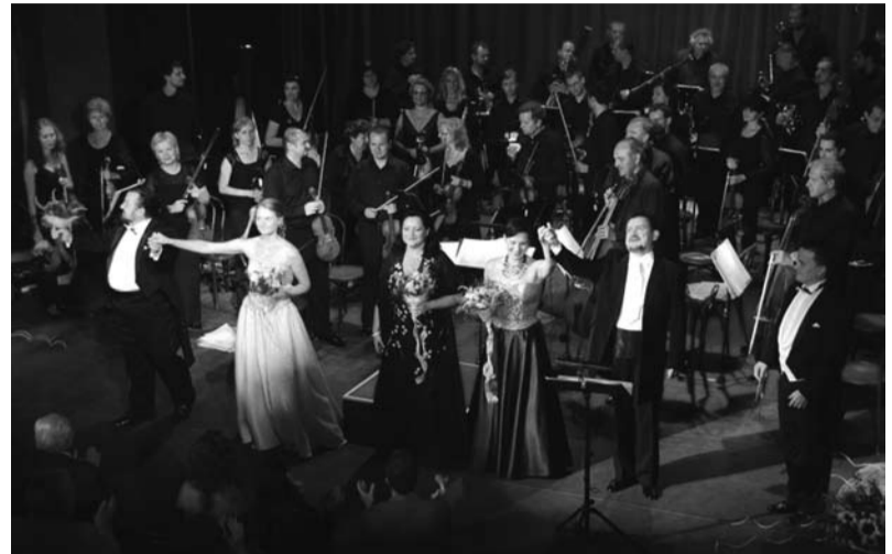
Gala Jubileuszowa

Organizatorzy zastrzegają sobie prawo zmian w koncertach i obsadach.